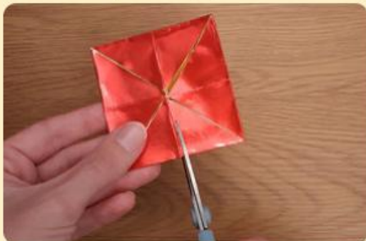
Papier wird eingeschitten