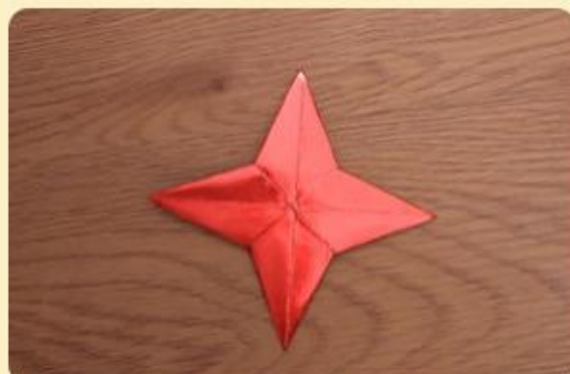
Einzelner Stern

Schön sieht er im Weihnachtsbaum oder an als Fensterschmuck aus.