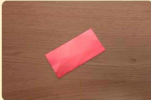
In der Mitte gefaltetes Stück Alupapier; Bild: Internet-ABC