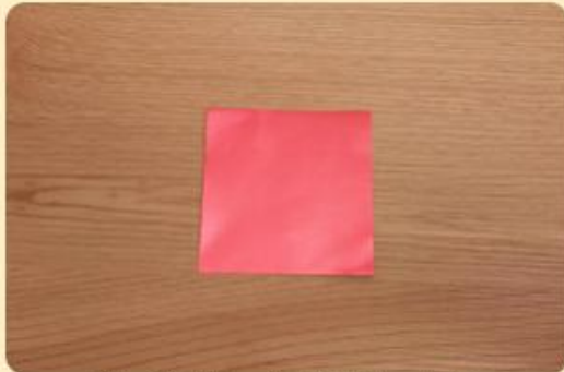
Rotes Blatt Alupapier

Auf dem Blatt Papier sollten die Faltkanten nun aussehen wie ein Stern.