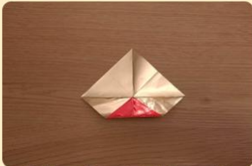
Nach innen gefaltetes Papier; Bild: Internet-ABC

Jetzt klappt ihr die Ecken um, sodass ein Stern entsteht.