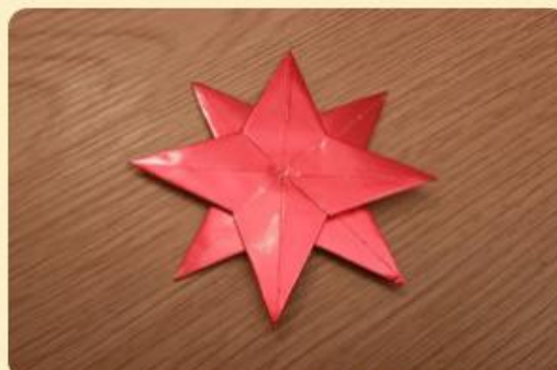
Roter gebastelter Winterstern