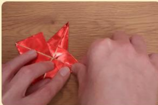
Ecken werden umgeknickt; Bild: Internet-ABC