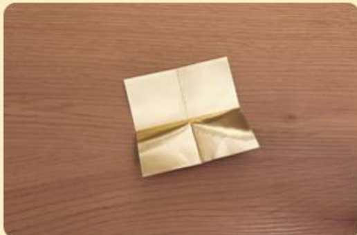
Aufgefaltetes Papier; Bild: Internet-ABC