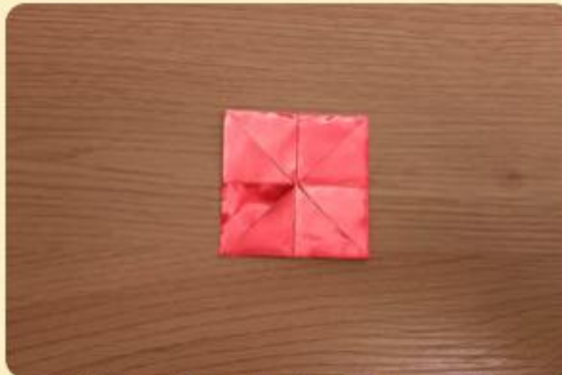
Kleines gefaltetes Quadrat