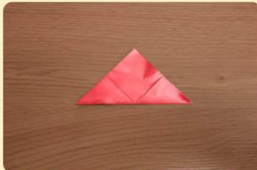
Papier ist in der Mitte gefaltet; Bild: Internet-ABC